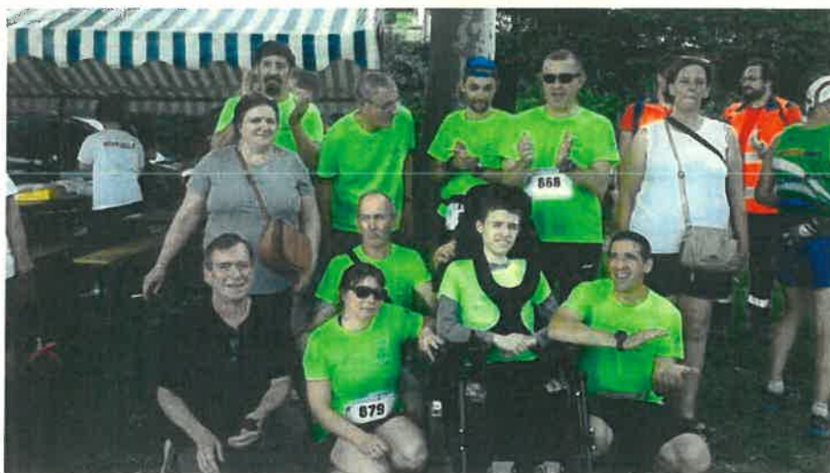
Photo de famille .....